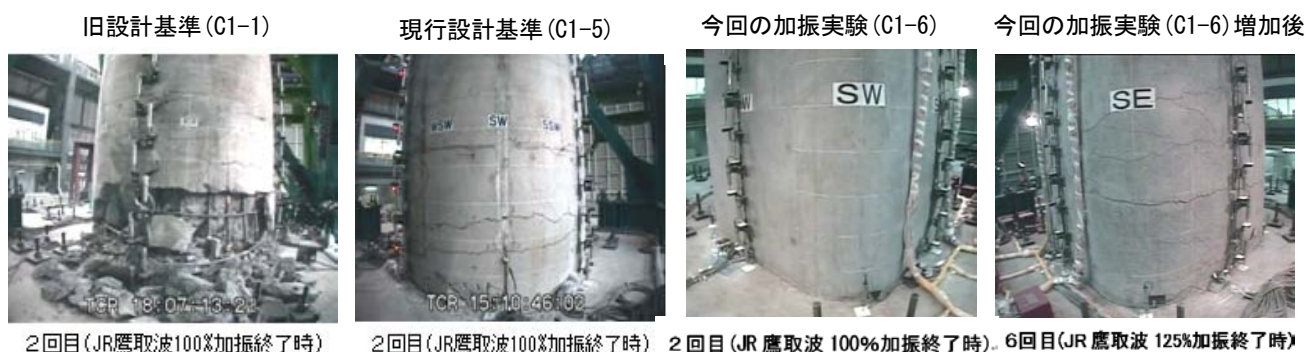
写真-2 既往実験結果との比較

その後、一度大きな地震動を受けた後のRC橋脚の最大耐力の検証を目的として、上部構造重量を21%増加しての加振を1回、さらに入力地震動を125%にした加振を3回行ないました(写真-2)が、大きなひび割れが生じたものの、化学繊維を入れたモルタルの剥離はわずかであり、新素材を用いた橋脚は高い耐震性を有していることが確認できました。