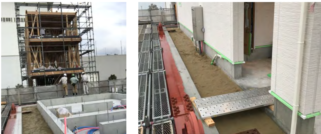
写真 地盤上のべた基礎 注4 施工状況

一連の実験では、耐震等級3の住宅の耐震性、配管類含む非構造材の機能保持性、室内安全性、免震工法の性能、補修効果等を検討し、最終的には、いずれの棟も基礎部分を完全に固めた条件にして、建物倒壊までの耐震余裕率を確認します。