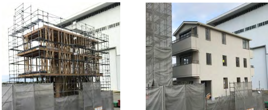
写真 3階建てのモデル（図1）の施工状況