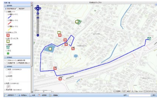
左：e 防災マップ作成の様子（当研究所一般公開にて）、右：作成したマップの例