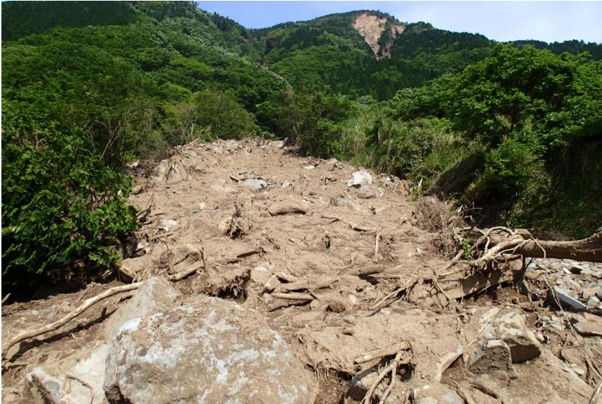
地震後の降雨によって発生したと考えられる土石流（5月21日撮影）