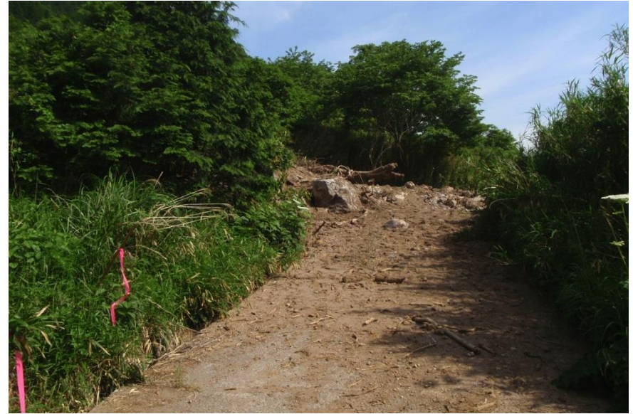
土石流によって閉塞された道路（5月21日撮影）