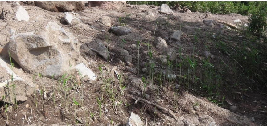
崩土の中から回復しつつある植生（5月21日撮影）