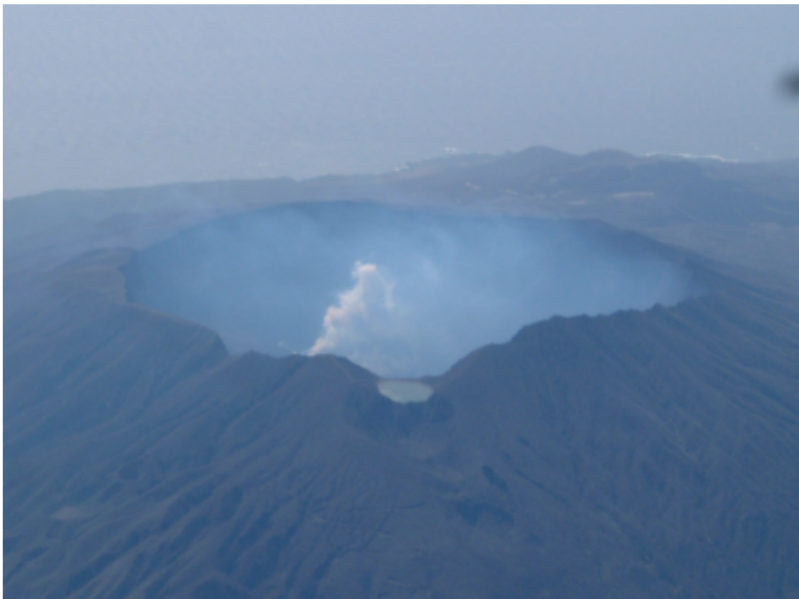
Fig.2 観測当日(2003/10/23)の三宅島の写真