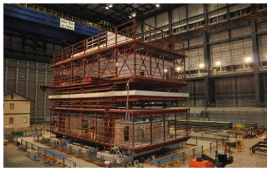
震動台上の試験体