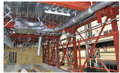
設備機器の取り付け状況