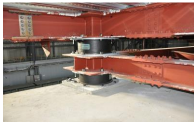
縮約層の積層ゴム