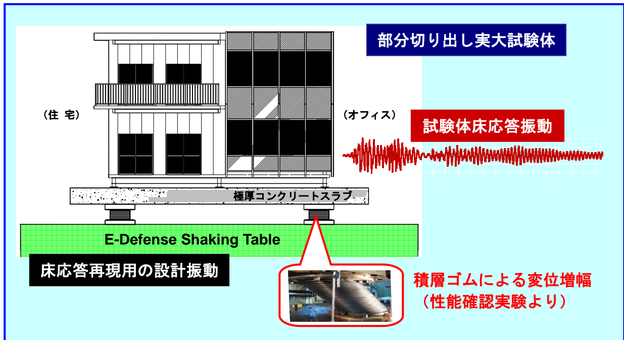
(1) 実験システムの概略