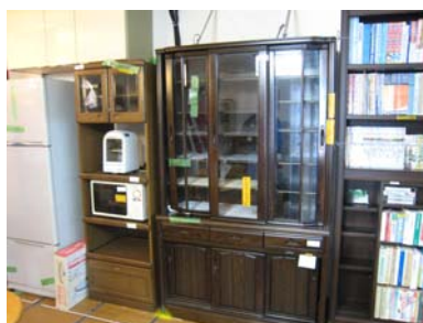
(b) 住宅内部 1