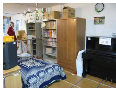
(c) 住宅内部 2