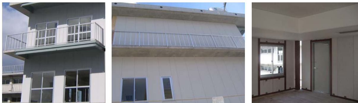
(a) 引き違いはき出し窓 (b) 引き違い窓, 外開き窓 (c) 引き違い窓, ドア (内側)

本実験においては、面内の変形のみならず、面外方向に強制変形、慣性力を受けること、またコーナー部に2方向の面内変形が集中することなど、既往の実験において考察できていない内容が含まれており、こうした条件下においてどのような挙動を示すか観察します。引き違いはき出し窓のガラスにはフロートガラスと合わせガラスが採用されており、ガラスの種類により地震時の挙動がどのように異なるかを検証します。