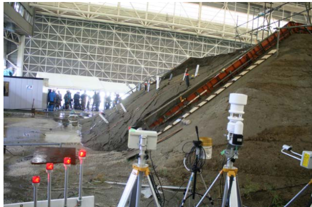
斜面崩壊実験後の斜面とセンサーの様子

昨年 8 月には、ゲリラ豪雨が再現できるように更新した大型降雨実験施設を用い、センサーによる崩壊予測手法の検証のための大型模型実験を行いました。この実験は、民間企業 7 社と日本地すべり学会が参加し、産官学が一体となった新たな取り組みとして行ったものです。ここでは、このようなシーズの掘り起こしを目的とした産官学連携推進のための大型実験研究の役割や課題、その成果をニーズに応じた社会実装へと導くための課題などを紹介します。