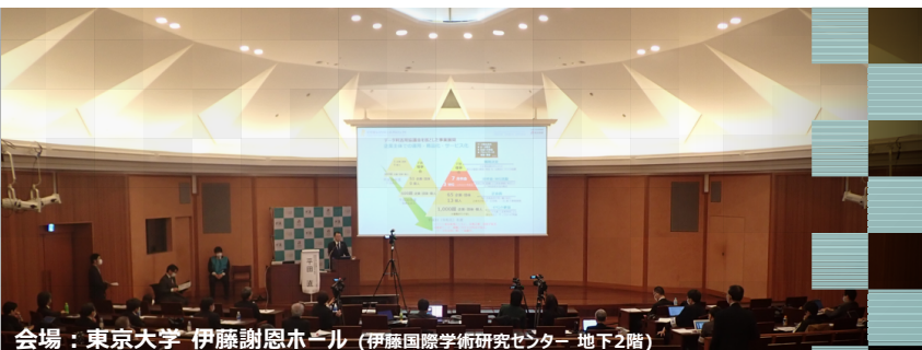
会場：東京大学 伊藤謝恩ホール (伊藤国際学術研究センター 地下2階)