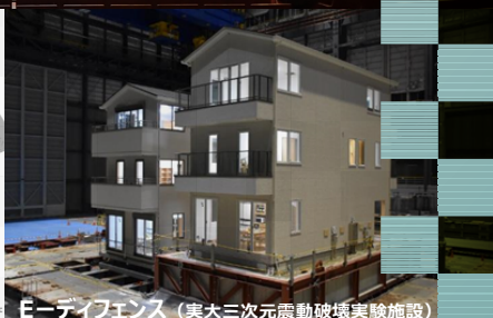
E-ディフェンス (実大三次元震動破壊実験施設)