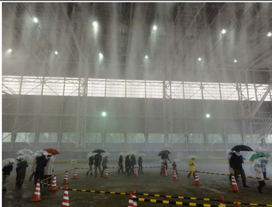
降雨体験のイメージ（科学技術週間一般公開時の様子）