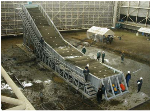
写真2 土砂災害実験例