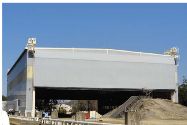
写真 1 大型降雨実験施設全景

具体的には、降雨の強さを 200（mm/時間）から 300（mm/時間）に増強し、雨滴の最大径を 2.2 mm 程度から 6mm 程度に拡大しました。