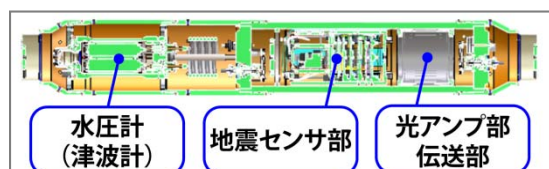
図2 観測装置の外観と内部模式図