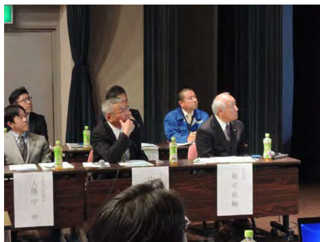
(前列右から) 福井下田市長、山本下田警察署長、犬藤下田海上保安部長