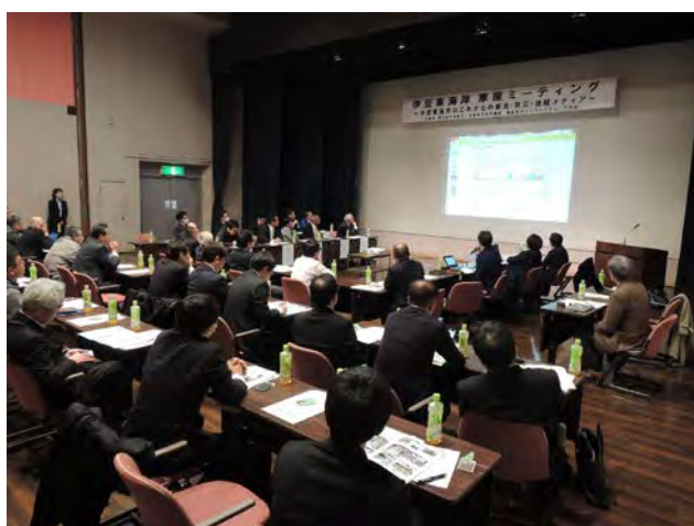
伊豆東海岸 車座ミーティングの会場