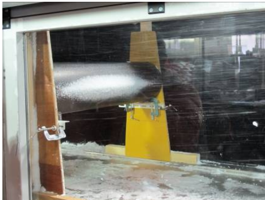
建築物の着雪対策