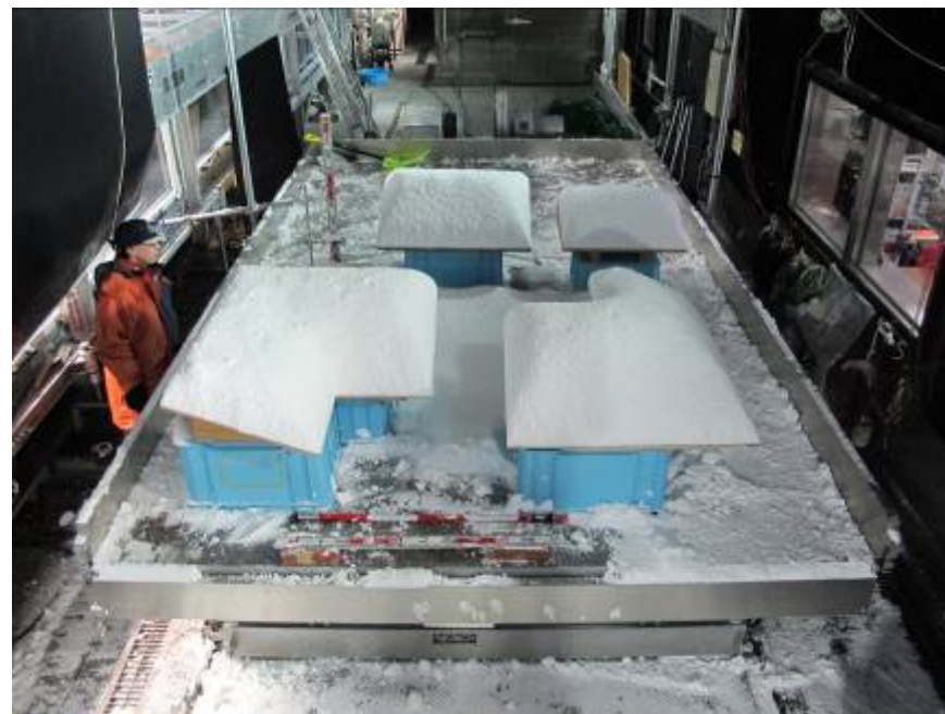
屋根雪の滑落特性