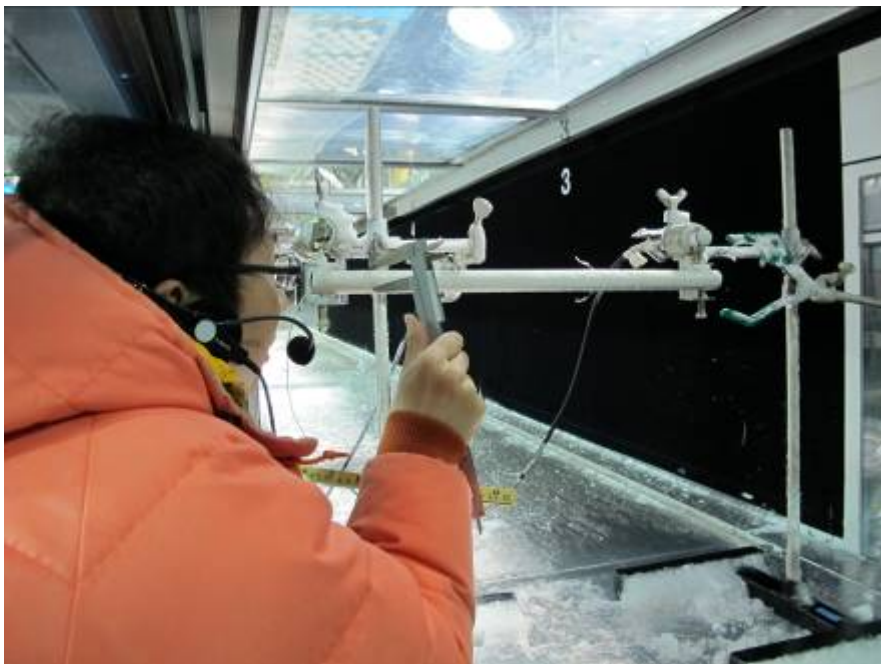
着雪のメカニズム