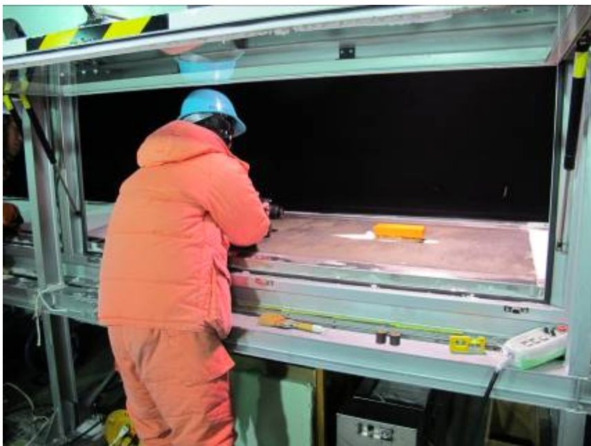
建物形状と吹きだまりの関係