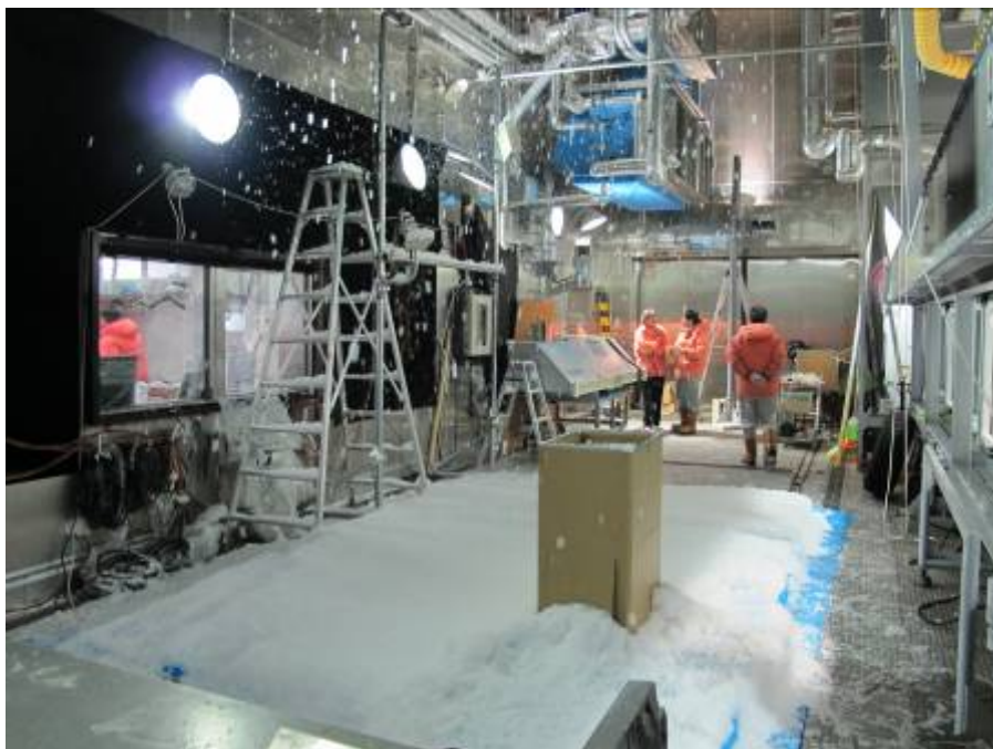
降雪粒子の自動測定技術