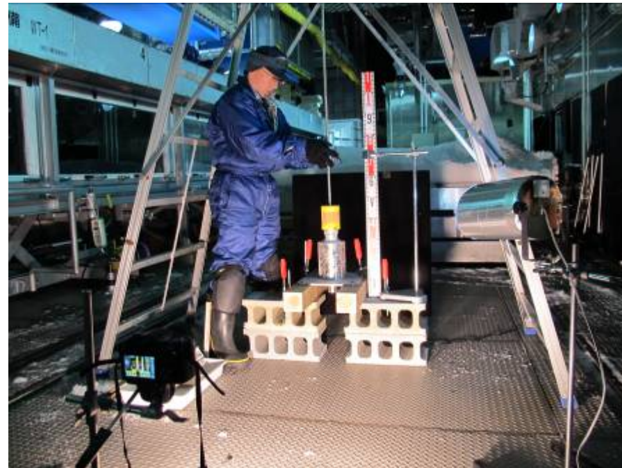
高速圧縮時の積雪の流動特性