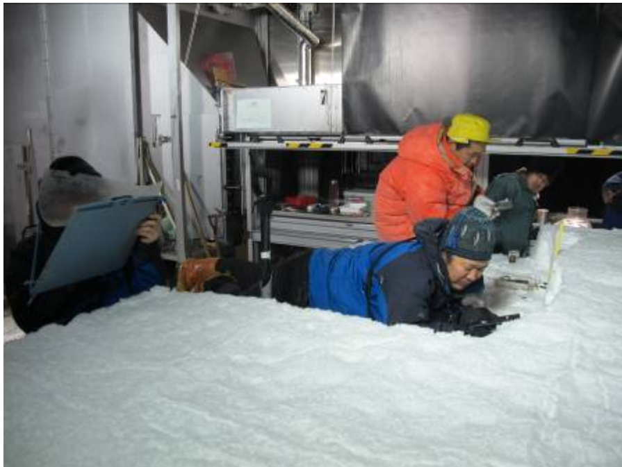
雪質の変化と雪崩の発生機構