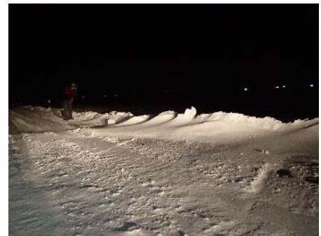
図 1 宮城県大崎市（アメダス古川付近）の道路路肩における吹きだまりの形成状況。

図 3 にアメダス古川で観測された気象要素の時系列を示す（風速、風向、気温は 10 分ごとの値、他の要素は 1 時間ごとの値）。1 月 19 日の明け方 4 時前後に 0.5 \sim 1.0 \text{ mm h}^{-1} 程度の降水（気温は 0^\circ\text{C} \sim 氷点下であり降雪と思われる）があり、その後正午にかけて気温は -3^\circ\text{C} 程度まで低下、風は著しく増加して高い吹雪の発生臨界（ 8 \sim 10 \text{ m s}^{-1} 程度）を大きく超えて、12 時には最大瞬間値で 27.8 \text{ m s}^{-1} に達した。気象庁によればこの値は 1 月としては観測開始以来、最も強いものとされる。強風時における風向は西北西（ 292.5^\circ ）ではほぼ一定であった。積雪深は明け方の降雪で 5cm 程