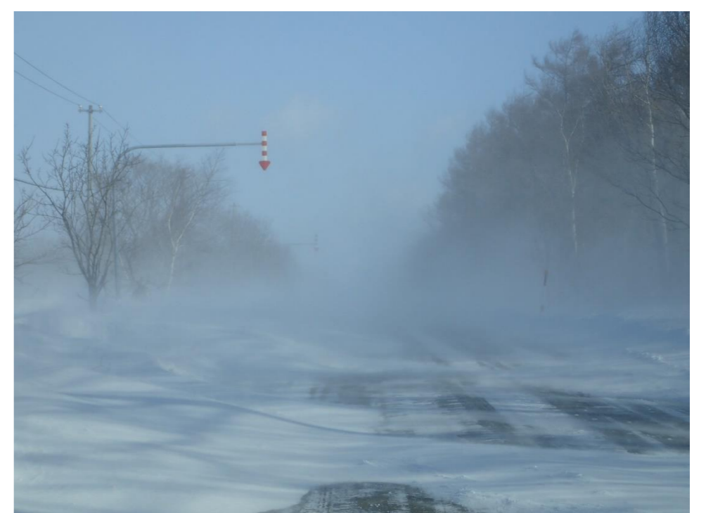
視程障害を引き起こす発達した吹雪。 視程障害と共に路面に吹きだまりも形成している。