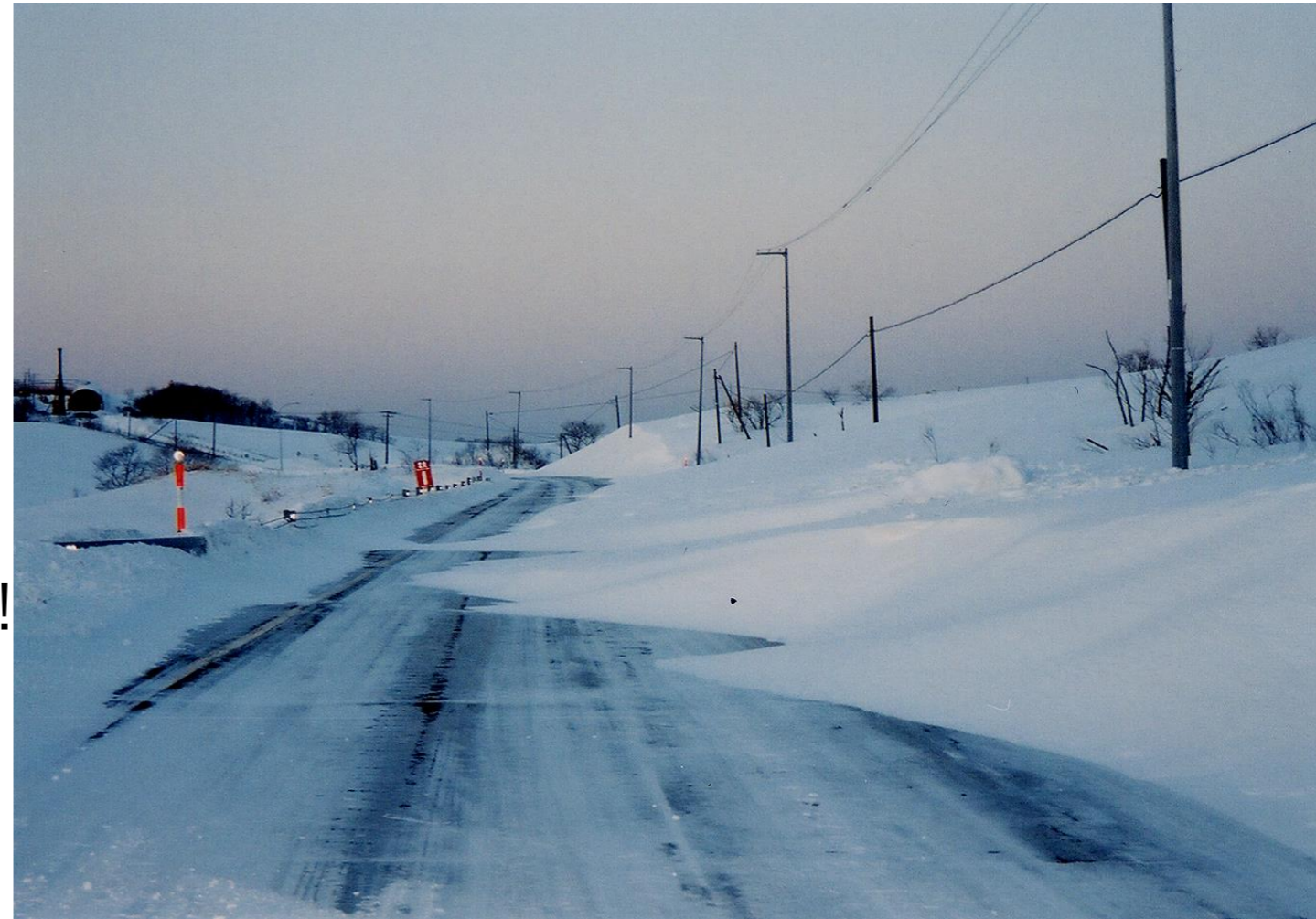
吹きだまりによって、道幅が制限された道路。 右側の電柱が本来の道幅を表す。