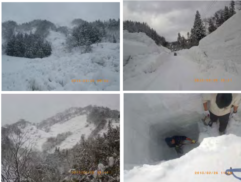
図2 長岡市栃尾地区における全層雪崩発生と積雪観測状況(栃尾田代)