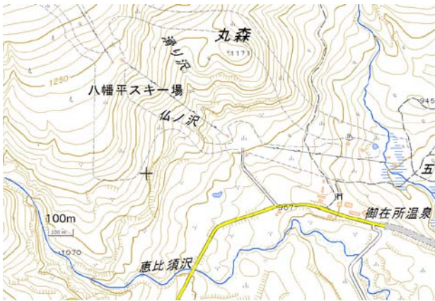
図1 雪崩破断面観測地点 (+印)

2月19日に八幡平アスピーテラインの御在所温泉から徒歩で雪崩発生現場に向かい、ロープで安全を確保した上で、発生区の破断面で積雪断面観測を行った(図1、2)。種類は面発生乾雪表層雪崩で幅は約150mであった。