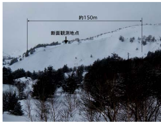
図2 雪崩の発生区と破断面