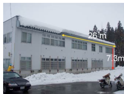
図1 崩落事故のあった建物屋根底部

屋根雪崩落事故発生の翌日、2008年2月12日に現地調査を実施した。建物は勾配2°の陸屋根構造で、庇付近は下にカーブがついており、この庇からせり出した屋根雪の一部(幅26m、長さ1m、厚さ0.5m)が崩落した(図1)。庇の地上高は7.3mであった。屋根面はカラー折板葺きである。建物付近の地上および屋根上における積雪の深さと全層平均密度は、それぞれ75cmと282kg/m 3 および52cmと280kg/m 3 であった。雪質はどちらもほとんどがしまり雪であったが、底面付近には厚さ10cm程度のざらめ雪があった(図2)。